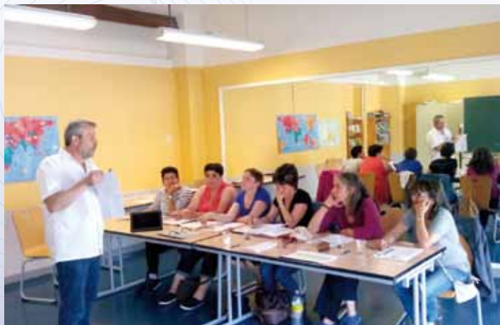
Le 25 juin 2015 : Formation « Clair et Net » et fiche méthode