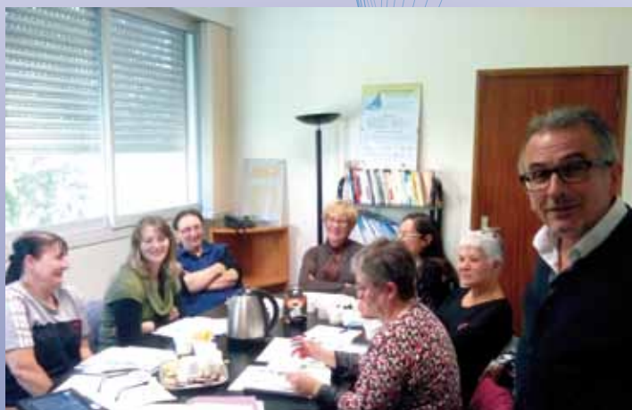
Le 1 er octobre 2015 : Formation « Clair et Net » et fiche méthode